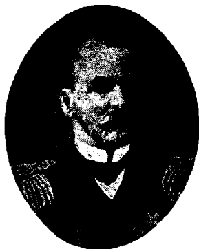
Свиты Его Величества контръ-адмиралъ З. П. Рожественскій, командующій второй тихоокеанскою эскадрой.