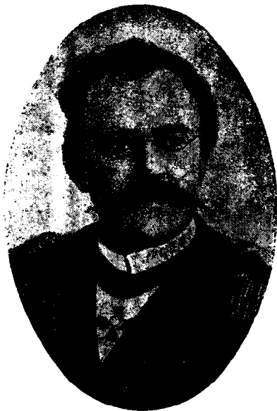
Капитанъ 1-го ранга В. Н. Миклуха