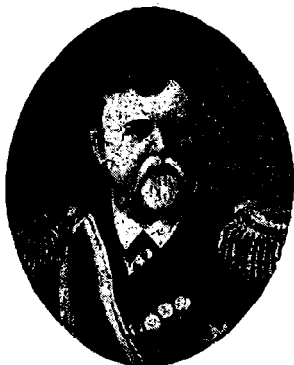
Контръ-адмиралъ Д. Г. фонъ-Фелькерзамъ, флагманъ вто- рой тихоокеанской эскадры.