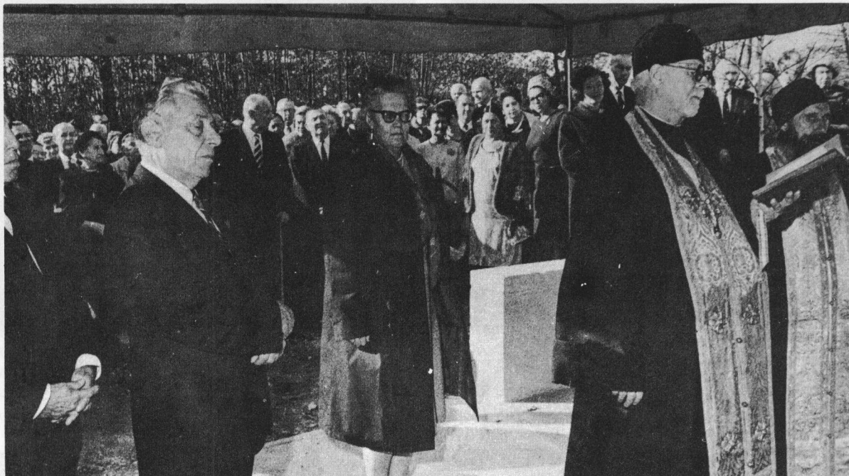
Торжественный молебен и освящение нового здания Исторического музея